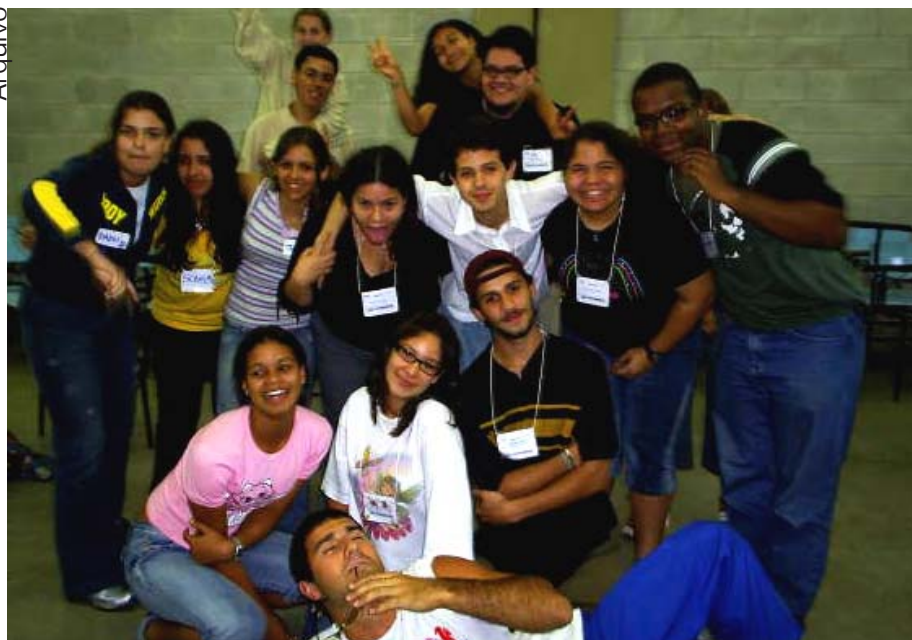
Parte da galera da equipe do Fala aí! faz pose para a primeira edição

nia, meio ambiente, projetos sociais, educação, lazer e trabalho.